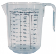
un verre doseur

Pour mesurer des contenance, tu peux utiliser différents instruments :